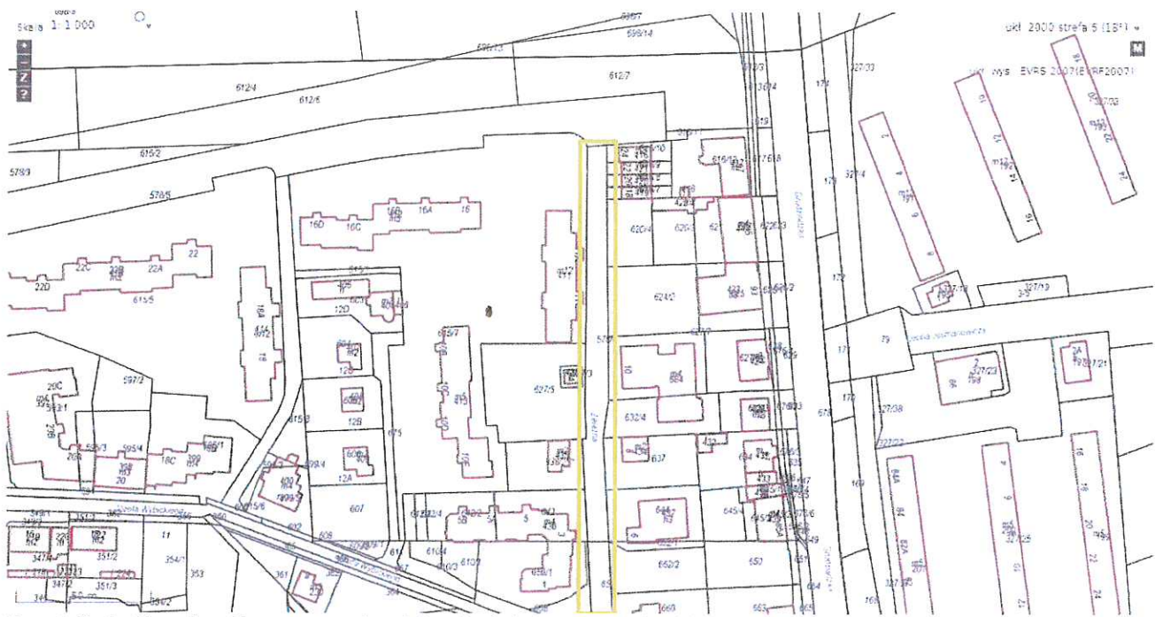
Rys.1 Lokalizacja ulicy na mapie objętej niniejszym wnioskiem.

Zwracamy się z prośbą o pomoc w sprawie dla nas ważnej chodzi o przebudowę ulicy, która jest dla nas także chodnikiem . Ulica posiada liczne ubytki, wykruszenia przy krawężniach co postaramy się tu udowodnić załączoną dokumentacją fotograficzną. Na obecny stan nawierzchni znacznie wpłynęła budowa bloku nr 10 przez P.B.URBAŃSKI ( fot.1). Prace przy budowie rozpoczęły się w kwietniu 2018 r i blok został oddany do użytku w kwietniu 2020 r. Przez ten czas stan ulicy Żelaznej wraz z chodnikiem ulegał znacznemu pogorszeniu. Niezbędny ciężki sprzęt (koparki, betoniarki, wywrotki itp.) zrobiły swoje ale i uszkodziły dużo (fot.2). Na części ulicy krawężnik został zrównany z poziomem asfaltu co spowodowało powstanie zagłębienia. Dodatkowo w celu podłączenia budynku Żelazna 10 do ujęcia wody i kanalizacji sanitarnej ulica została rozkopana, a załatwienie dziur odbyło się bez podbudowy (fot.5). W zasadzie cała długość naszej ulicy w praktyce nie ma podbudowy, dziś widzimy, że ulica Żelazna nie była przystosowana do wjazdu ciężkiego sprzętu co spowodowało dodatkową destrukcję i degradację nawierzchni ulicy i chodników. P.B.URBAŃSKI przed rozpoczęciem prac zobowiązał się wraz z ZDM naprawić uszkodzenia i odnowić chodniki oraz miejsca parkingowe . Mieszkańcy bloku Żelazna 11 i 11 A byli o tym informowani pisemnie przez Administrację MSM osiedla Lelewela i Kołłątaja wywieszonym w gablocie pismem. Najwyraźniej już P.B.URBAŃSKI zapomniało o obietnicy a kartkę zdjęto ale my pamiętamy .