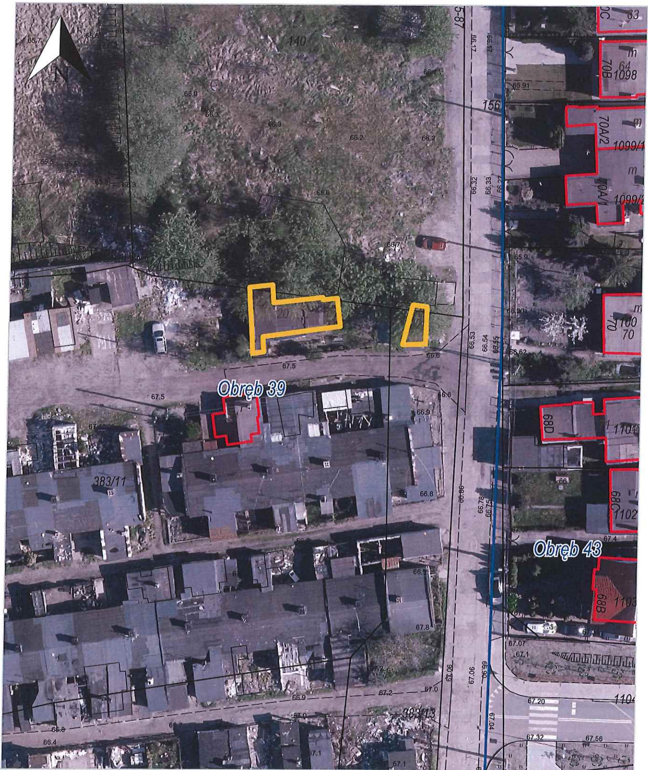
Obręb 39, Toruń | Obręb 43, Toruń