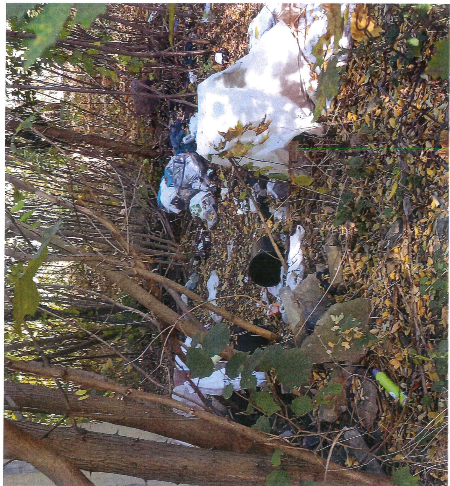
Śmieciowisko przy działce 101/3 - miejsce pod parking