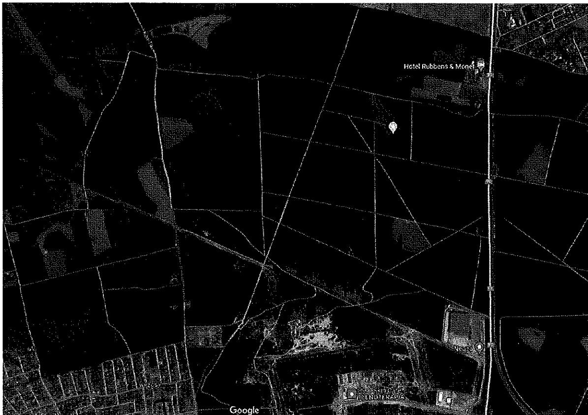
Rys nr.1 Lokalizacja drogi na mapie objętej niniejszym wnioskiem.