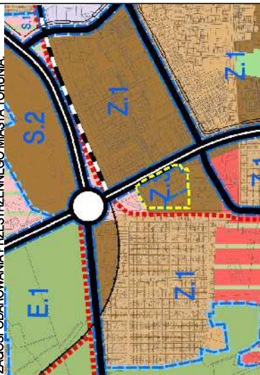
RYSUNEK PLANU SKAŁA 1:1000

WYRYS ZE STUDIUM UWARUNKOWAŃ I KIERUNKÓW ZAGOSPODAROWANIA PRZESTRZENNEGO MIASTA TORUNIA: